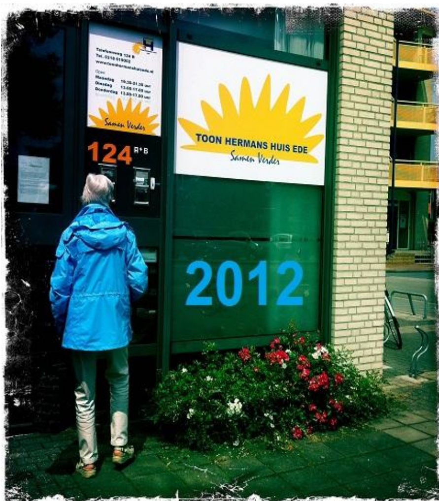
Jaarverslag Toon Hermans Huis Ede